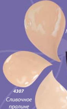
4307 Сливочное пранле